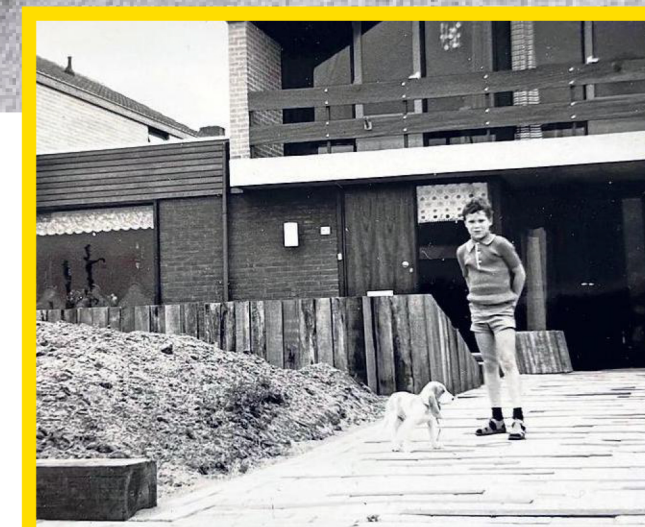
„Mijn moeder heeft mij een aantal dingen niet kunnen meegeven, zoals troost, warmte en zachtheid.”

„Die keuze kwam destijds als een drietrapsraket binnen denkeren. Het begon in 2017 met een relatiebreuk, na twintig jaar, met de moeder van mijn jongste kinderen. In diezelfde periode gingen er vijf vrienden van mijn leeftijd dood, waardoor ik vijf keer dacht: dit had ik kunnen zijn. Uiteindelijk werd ik in 2018 zelf ziek. Het is nooit helemaal dui-