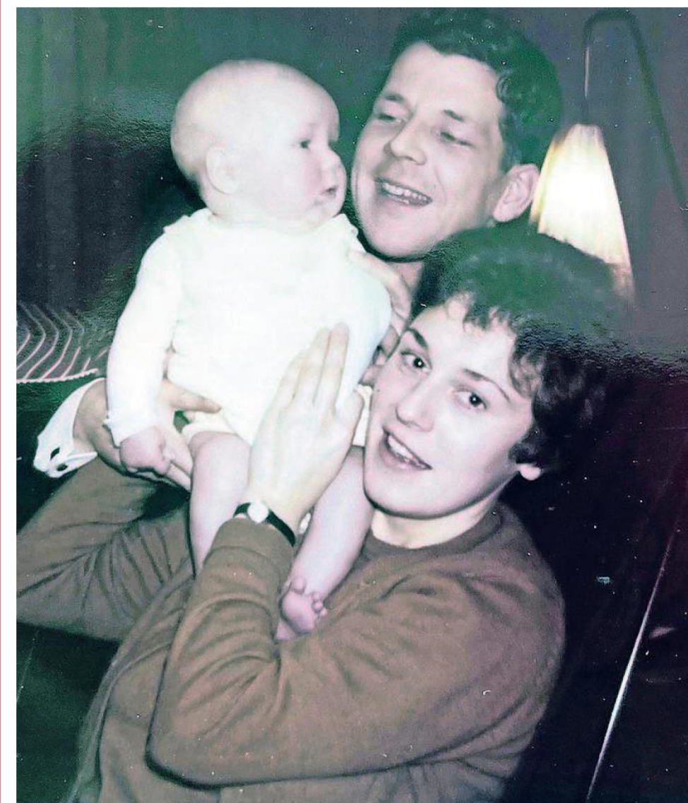
Onlangs verbraken zijn ouders definitief het contact met Bakker. „Mijn vader was er nooit en mijn moeder kon zich niet goed verhouden tot haar eigen emoties.”